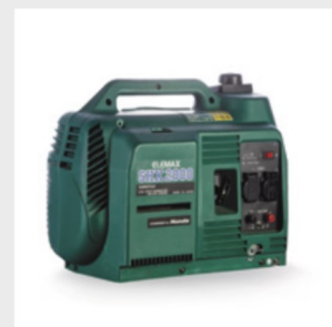
10.412 2KVA Générateur silencieux