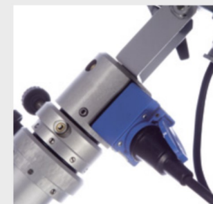
BP.3400 Schuko prise de courant